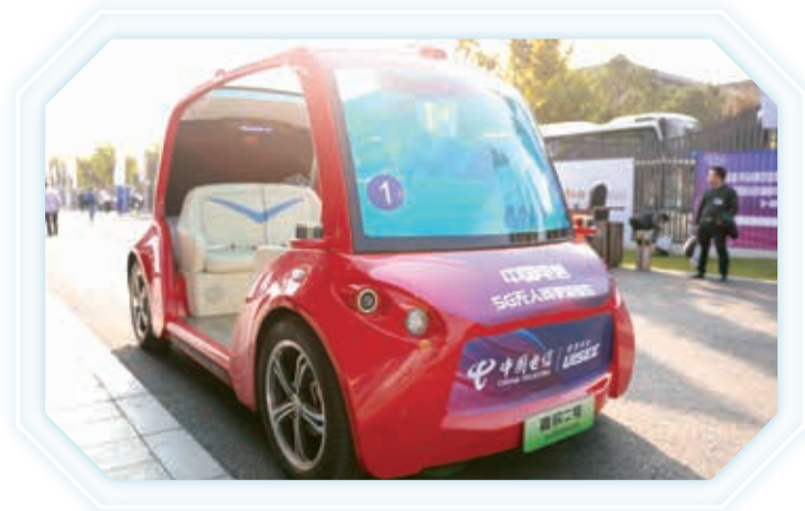
第六屆世界互聯網大會上演示5G無人駕駛

公司繼續深度參與5G全球標準演進，主導多項5G國際標準的制定，完成眾多專利申請和國際標準文稿，創新SA組網方案，攜手多廠家進行SA組網測試，率先突破4G/5G融合等SA商用部署瓶頸，獲GSMA指定牽頭全球5G SA產業制定並適時發佈《5G SA部署指南》，自主研發MEC平台和網絡切片管理平台，推進SA產業加快成熟，創新研發室內覆蓋系列技術，推動低成本室內覆蓋解決方案。公司對於5G核心技術和能力的掌控持續增強，在全球5G產業鏈的地位顯著提升。