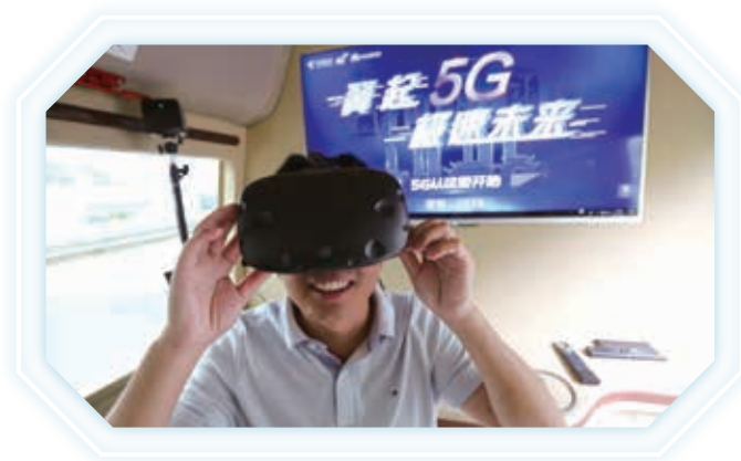
2019年電信日，湖南市民紛紛前往體驗電信5G應用

積極佈局家庭信息化，智能寬帶、智家平台、智能應用、智能安全和智能服務五位一體的智慧家庭產品服務體系已初見規模，在白熱化的市場競爭中，公司寬帶用戶規模持續擴大，用戶黏性保持穩定。全年有線寬帶用戶達到1.53億戶，淨增734萬戶，寬帶用戶三重打包融合率 7 達到64%，IPTV用戶達到1.13億戶，全屋Wi-Fi、天翼看家和家庭雲等智慧家庭應用日趨豐富，價值貢獻逐步顯現，寬帶用戶綜合ARPU為人民幣42.6元。