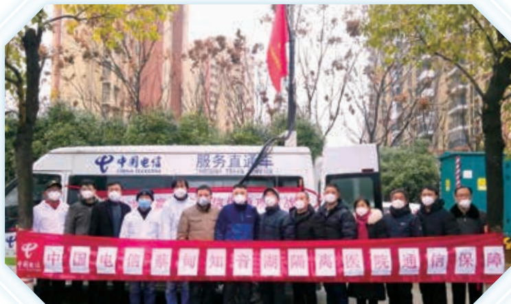
為武漢火神山醫院提供通信保障

2020年伊始，新型冠狀病毒肺炎疫情突發，給公司的業務發展和網絡建設造成影響。中國電信積極踐行企業社會責任，率先開通武漢火神山醫院等地的5G網絡，發揮天翼雲和大數據等業務優勢，支撐疫情防控和診療信息化，積極採取措施關心關愛員工生命安全和身體健康。同時，公司